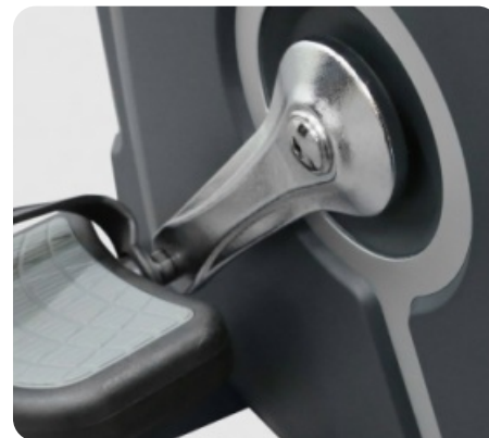
ТРЕХКОМПОНЕНТНЫЙ ПЕДАЛЬНЫЙ УЗЕЛ