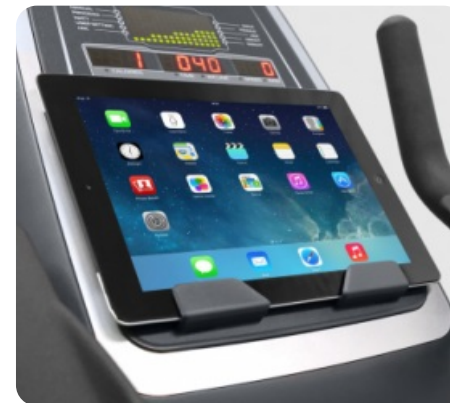
ПОДСТАВКА ПОД ПЛАНШЕТ ИЛИ СМАРТФОН