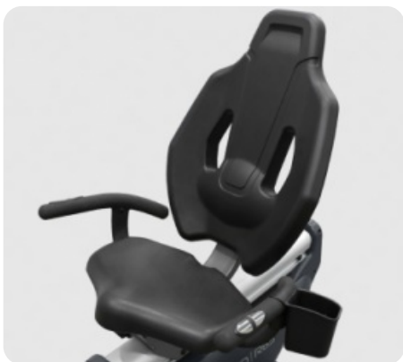
КОНТУРНОЕ ЭРГОНОМИЧНОЕ СИДЕНИЕ