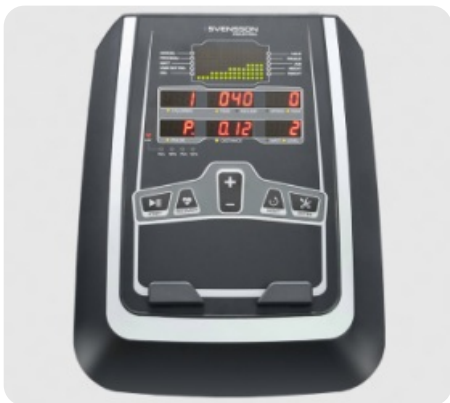
Дисплей профессионального уровня