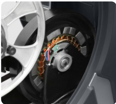
ИНДУКЦИОННАЯ СИСТЕМА НАГРУЖЕНИЯ