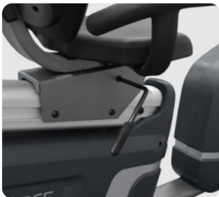
ГОРИЗОНТАЛЬНАЯ РЕГУЛИРОВКА СИДЕНИЯ