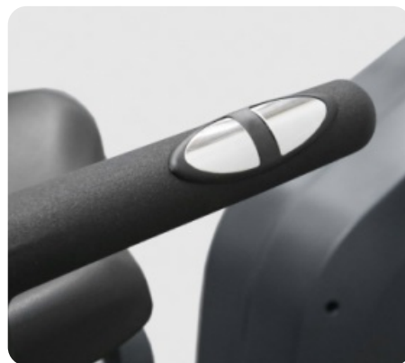
СЕНСОРНЫЕ ДАТЧИКИ ПУЛЬСА