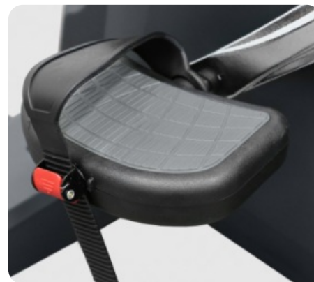
ПЕДАЛИ С ПРОРЕЗИНЕННЫМИ РЕМЕШКАМИ